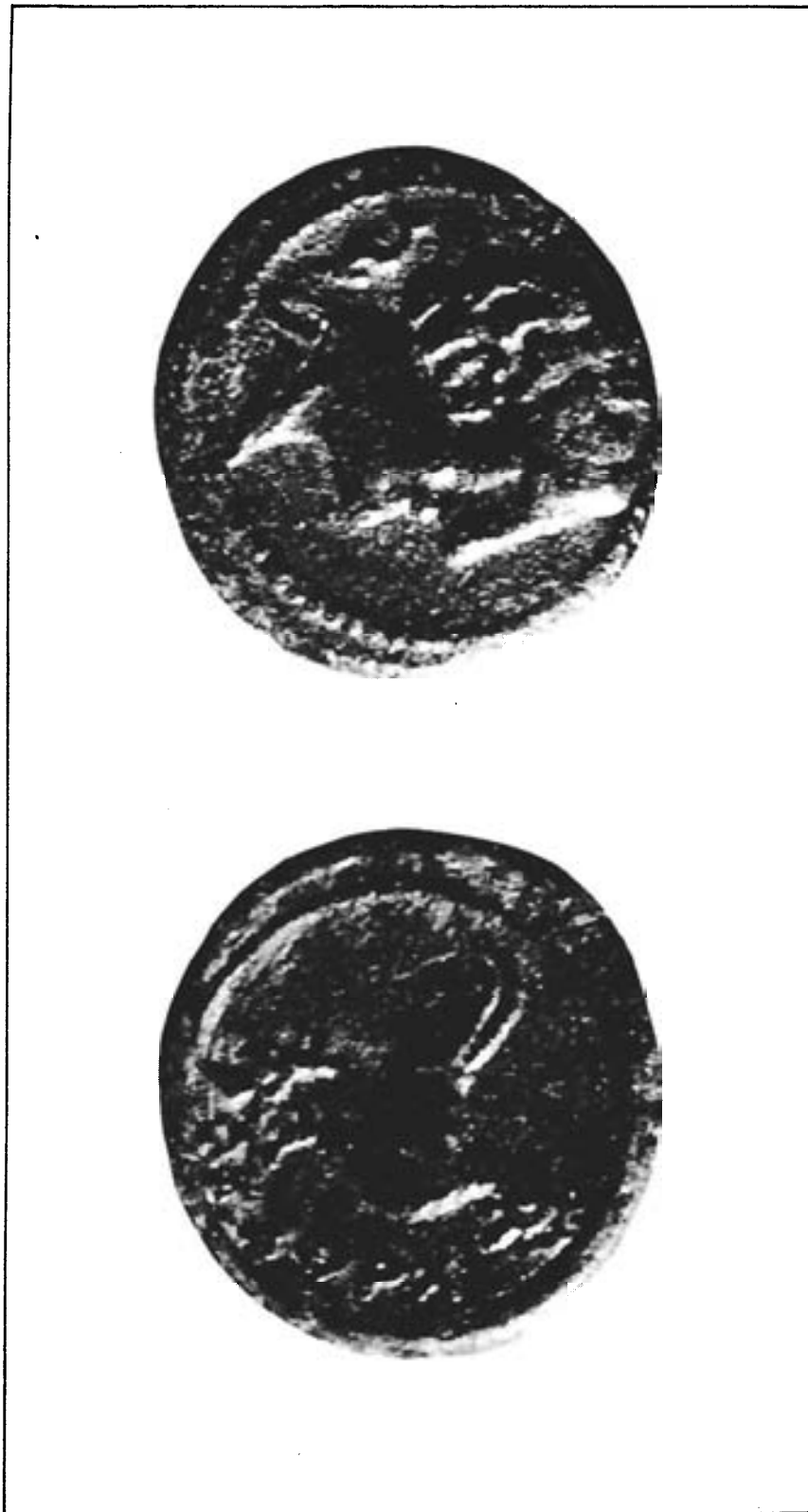
Moneda número 2.