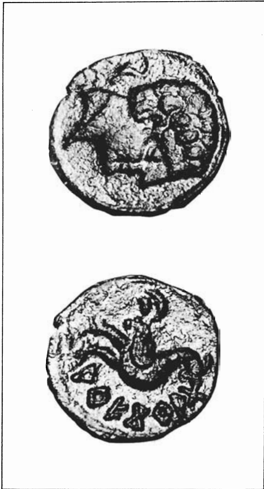
Moneda número 1.